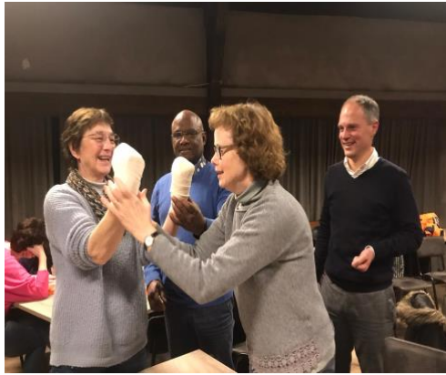
Herhalingsles; ernstige bloeding.

Er is nog 1 lid met een lotus aantekening, namelijk Threes Verhoef. Dat houdt in dat wanneer er Lotus nodig is, bijvoorbeeld bij examens, deze extern ingehuurd wordt.