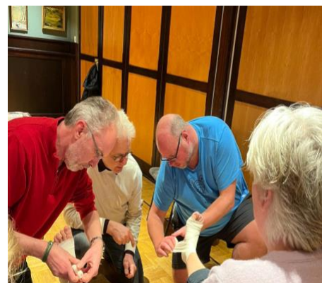
Basiscursus; verstuiking verbinden.

Reanimatie is een belangrijk onderdeel van deze herhalingslessen en staat dan ook twee keer in het schema zodat iedereen de kans heeft dit bij te houden.